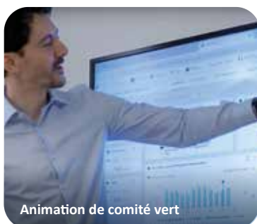
Animation de comité vert