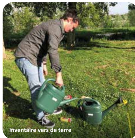
Inventaire vers de terre