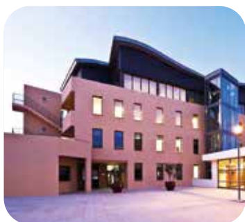
Pilotage énergétique de près de 200 sites pour notre maison mère (Onet).