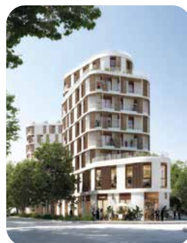
Construction d'un ensemble mixte en structure bois. BET thermique, fluides, AMO DD.