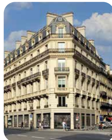
Restructuration complète d'un îlot tertiaire. AMO DD & commissionnement.