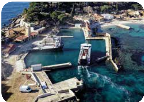
Rénovation d'un ensemble de bâtiments et renaturation d'un éco-système insulaire. AMO DD, biodiversité & commissionnement.