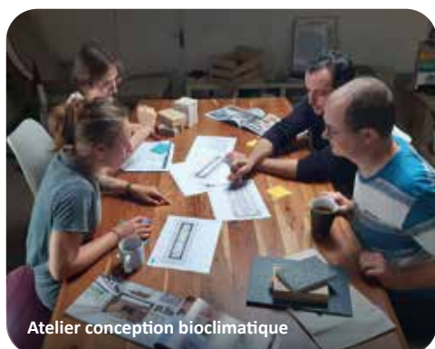
Atelier conception bioclimatique