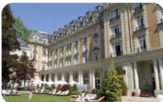
Rénovation d'un hôtel patrimonial classé. BET thermique, fluides, acoustique.