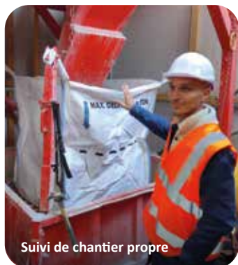
Suivi de chantier propre