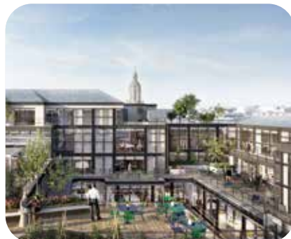
Accompagnement 360° d'un patrimoine en exploitation sur les enjeux énergie, carbone, climat, réglementaire. AMO DD.