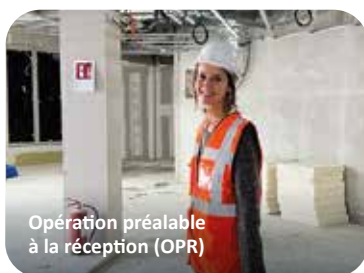
Opération préalable à la réception (OPR)