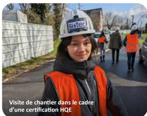
Visite de chantier dans le cadre d'une certification HQE