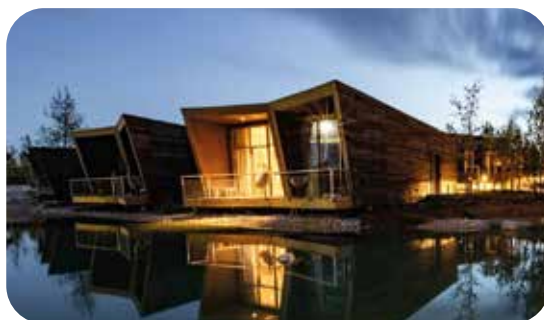
Construction d'un parc hôtelier d'écodolges, alliant biodiversité et sobriété énergétique. AMO DD & biodiversité.