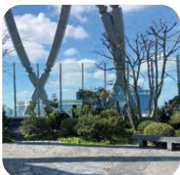
Certification HQE BD v4 pour la Tour D2 à La Défense. AMO DD.