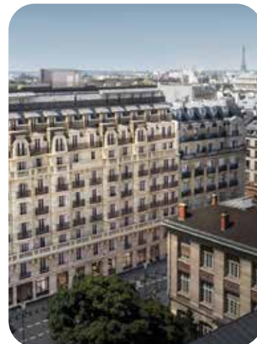
Réhabilitation complète d'un immeuble de bureaux Haussmannien. BET thermique et fluides.