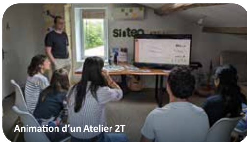
Animation d'un Atelier 2T