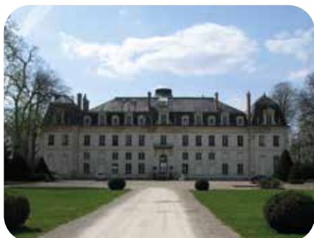
Sur un parc historique, réalisation du volet milieu naturel de l'étude d'impact. AMO biodiversité réglementaire.