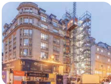
Réhabilitation complète d'un immeuble de bureaux style Art Nouveau. BET thermique, fluides, commissionnement et AMO DD.