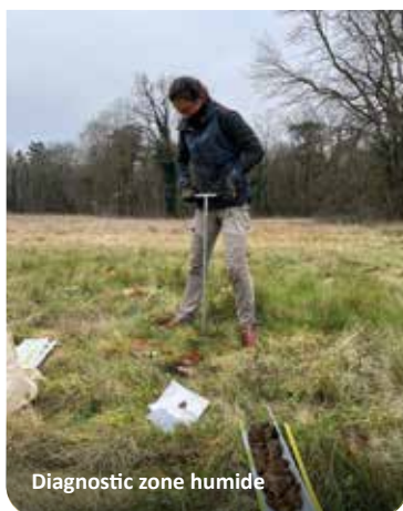
Diagnostic zone humide